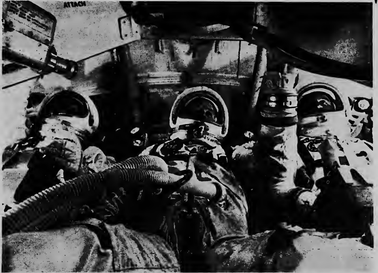
Den e posicion aki morto mester a sorprende e astronautan Roger Chaffee, Edward White y Virgil Grissom diabierna anochi ora qu candela a destrui nan nave durante un prueba na Cabo Kennedy.

E ultimo vuelo tripula sovietico a ser realiza na maart 1965, dia qu Alexei Leonov a hasi e prome "caminata den espacio" for di su nave".